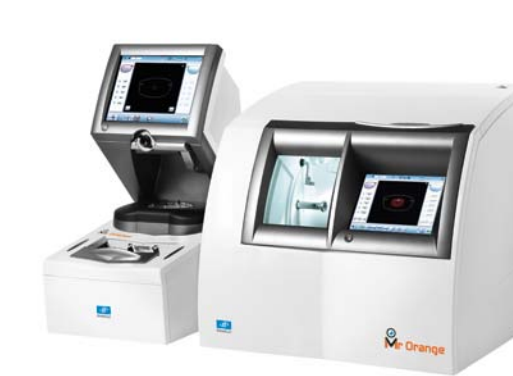
Mr Orange Configuraties