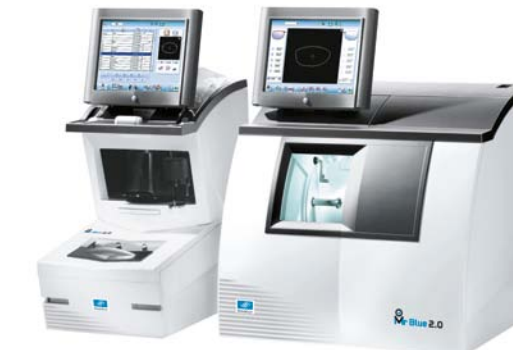
Mr Blue 2.0 Configuraties